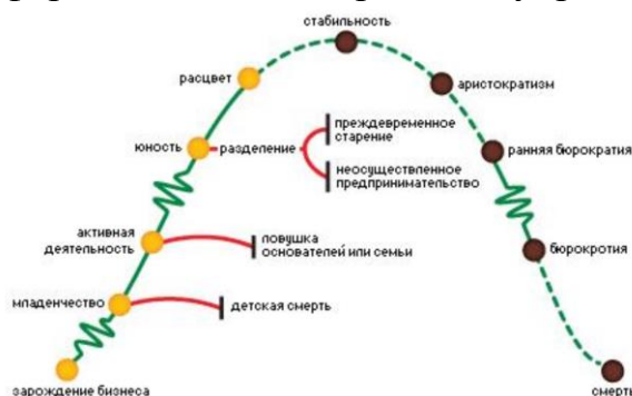
Рисунок 1 – Жизненный цикл компании по И.Адизесу

Задание 1. Выявить на какой стадии жизненного цикла компании по И.Адизесу (см. рис.1) возникает дилемма профессионализма и в чем ее специфика. Кто же должен возглавить работу по трансформации предпринимательского бизнеса в формализованный управленческий процесс? Может ли основатель бизнеса выполняющий функции владения и управления создать формализованные процессы управления?